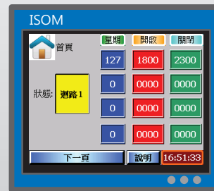
四組時間排程功能